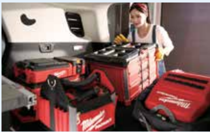
넓은 적재공간(1,462ℓ, 최대 300kg)