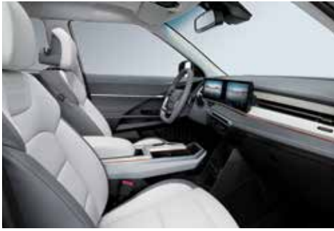
그레이 투톤 인테리어