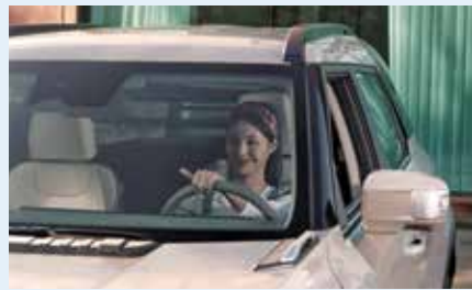
최대 주행 가능거리(1회 충전 411km 주행)