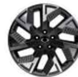
18인치 다이아몬드 커팅 휠 (타이어 : 225/60R18)