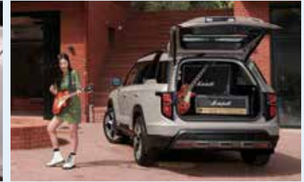
차량 외부에서 다양한 전자기기를 사용할 수 있는 실외 V2L