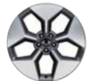
20인치 다이아몬드 커팅 휠 (타이어 : 245/45R20)