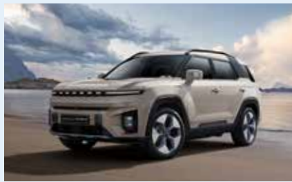
토레스 EVX와 동일한 외관 디자인