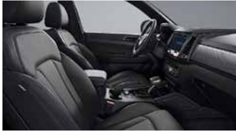
블랙 인테리어(블랙 헤드라잉)