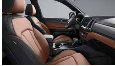
브라운 인테리어(블랙 헤드라잉)