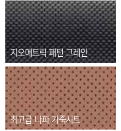
지오메트릭 패턴 그레인