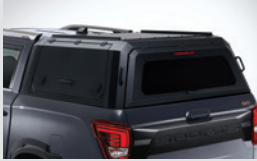
캐노피 탑 2,600,000원