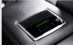
빌트인 공기청정기 400,000원