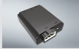
에어컨 습기 건조기 160,000원