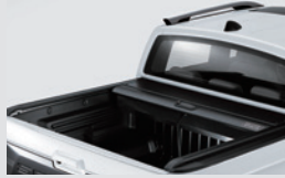
슬라이딩 커버 1,200,000원