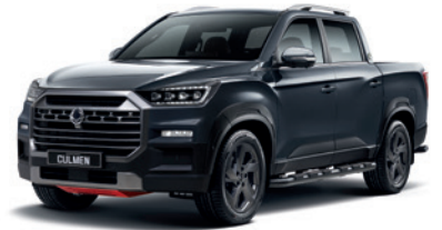
마블 그레이 ACM