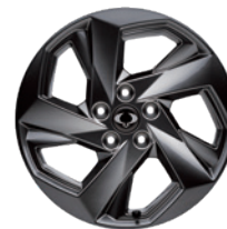
뉴 디자인 20인치 다크 스포터링 휠