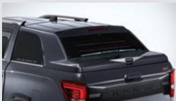
디렉스 쿨탑(G9) 1,815,000원