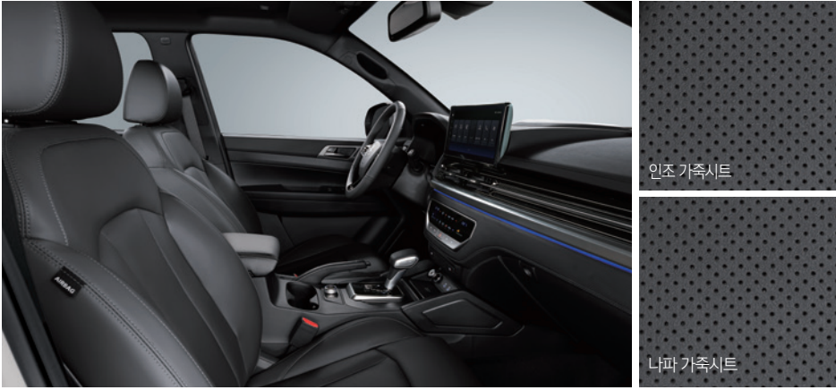
블랙 인테리어 (블랙 헤드라이닝)