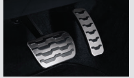
스포츠 페달 40,000원