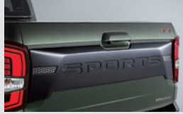
테일게이트 가니쉬 200,000원