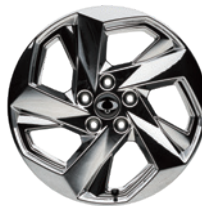
뉴 디자인 20인치 스포터링 휠