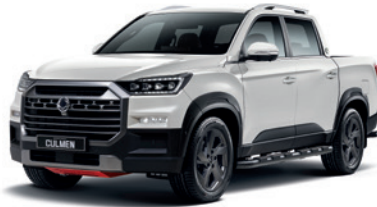
그랜드 화이트 WAA