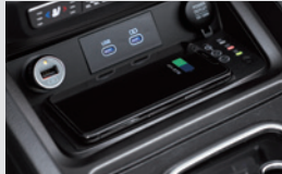
후대폰 무선충전기(15W) 160,000원