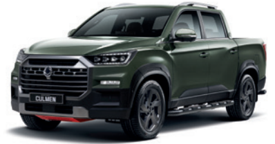
아마조니아 그린 GAM