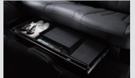
2열 시트 언더트레이 200,000원