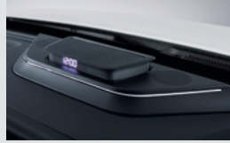
플로팅 센터 스피커 390,000원