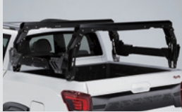
멀티 카고랙 1,300,000원