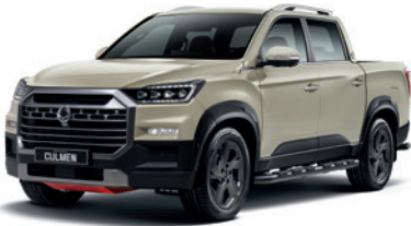
샌드스톤 베이지 EBK