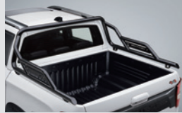
유틸리티 롤바 670,000원