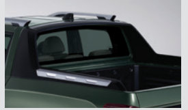
패션 데크랙 960,000원