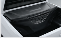
멀티 유틸리티 박스 510,000원