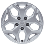
18인치 알로이 휠