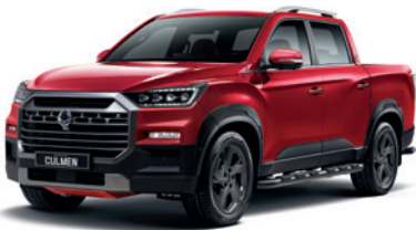
인디안 레드 RAJ

* 본 가격표에 수록된 제품의 색상은 인쇄된 것이므로 실제 색상과 다소 차이가 있을 수 있습니다.