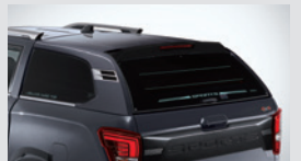
디렉스 하드탑(G4) 1,485,000원

* 상기 품목은 취급 설명서 내 커스터마이징 품목 보충서에 따라 보충 적용됩니다.