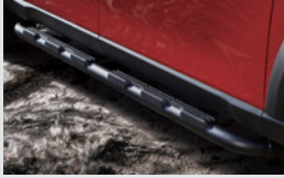
오프로드 사이드 스텝 550,000원