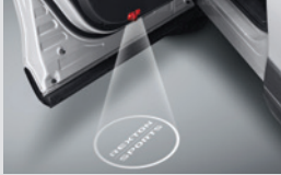
도어 스팟램프 & LED 도어스커프 230,000원