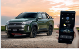
디지털 스마트 키 320,000원