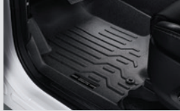
3D 데크매트 100,000원