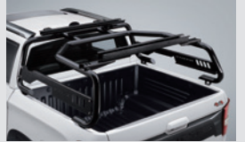
벙커 롤바 930,000원