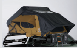
하드셸 루프탑 텐트 2,900,000원