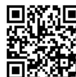
렉스톤 스포츠 컬멘 모바일 페이지