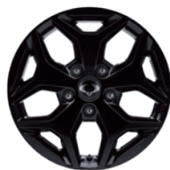
18인치 블랙 알로이 휠