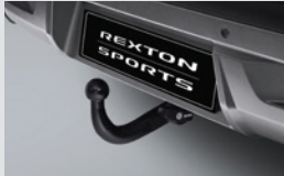
트레일러 히치 13핀(BRINK) 1,200,000원