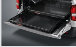
슬라이딩 베드 500,000원