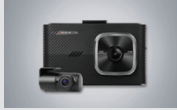
아이나비 블랙박스(16GB) 220,000원