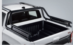
모던 롤바 670,000원