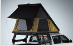
A형 루프탑 텐트 2,800,000원