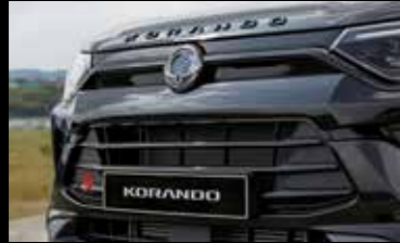
블랙 라디에이터 그릴