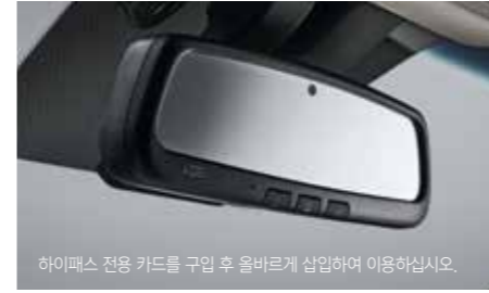
하이패스 전용 카드를 구입 후 올바르게 삽입하여 이용하십시오.