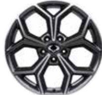
18인치 다이아몬드 컷팅 휠 (타이어 : 235/55R18)