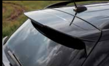
블랙 리어 스포일러