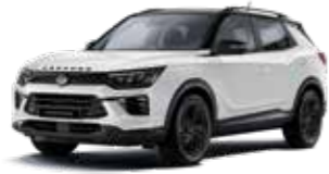
그랜드 화이트 2WA