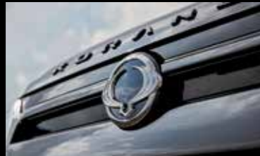
블랙 윙 엠블럼(전면/후면)