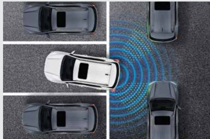
후측방 접근 경고 RCTW (Rear Cross Traffic Warning) 주차공간이나 후진 주행 시 센서가 차량에 접근하는 물체를 감지하면 운전자에게 위험을 경고하여 미연에 사고를 방지할 수 있습니다.