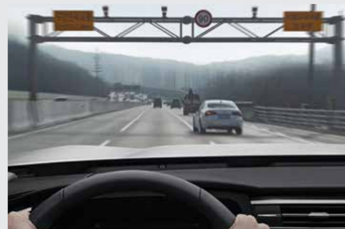
고속도로 안전 속도 제어 SSA (Safety Speed Assist) 고속도로 주행 시 내비게이션 정보(고정식/이동식/구간 단속정보)와 차선 중심 추종 제어(횡방향 제어) 기술을 바탕으로 고속도로 주행을 보조해 줍니다. (*내비게이션 선택 시 사용 가능)