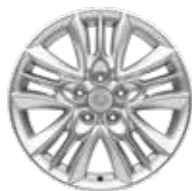
17인치 알로이 휠 (타이어 : 225/60R17)