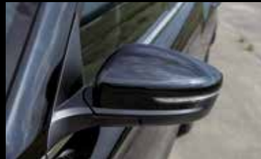
블랙 아웃사이드 미러