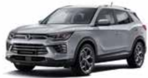
아이콘 메탈 ADE