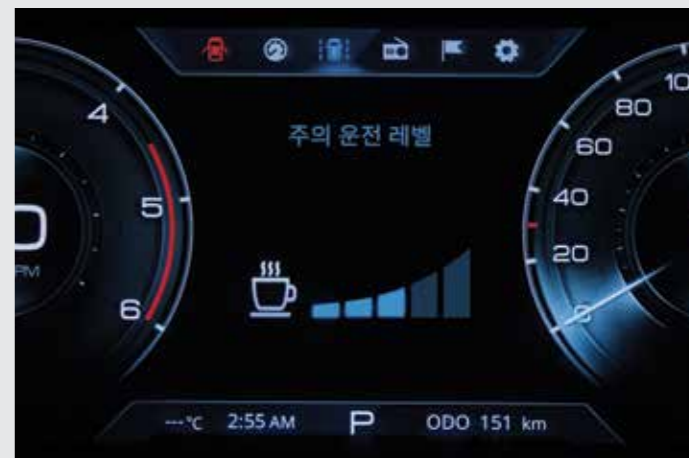
부주의 운전 경고 DAW (Driver Attention Warning) 차량 주행 패턴과 전방 카메라에 수집된 정보를 분석하여 주의 운전 레벨 및 경고를 알려줍니다.