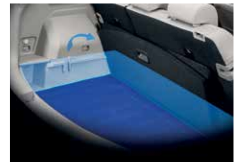
2단 매직 러기지 보드 제거 시 (551ℓ 적재 공간)