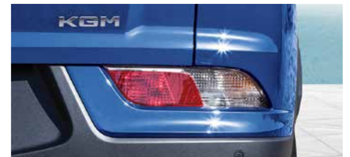
보조램프(리플렉스 리플렉터, 후진등, 방향지시등)