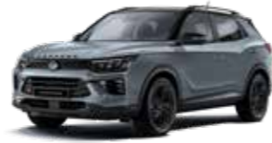
플래티넘 그레이 2AD