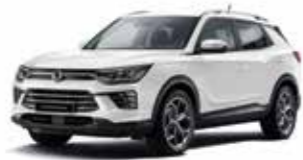
그랜드 화이트 WAA