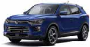
덴디 블루 BAS