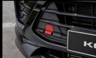
레드 토잉 커버