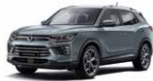
플래티넘 그레이 ADA