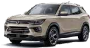
라메 그레이 EBL