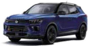
덴디 블루 2BS