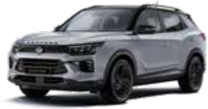
아이콘 메탈 2DE