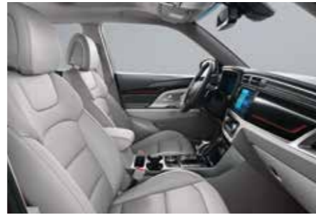
소프트 그레이 인테리어(그레이 헤드라이닝)