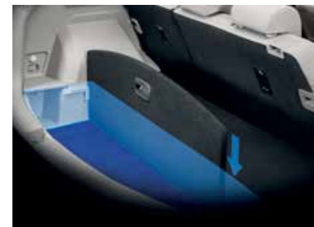
2단 매직 러기지 보드 활용 시