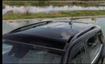
블랙 유틸리티 루프랙/블랙 투톤 루프