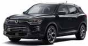
스페이스 블랙 LAK