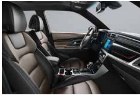
에스프레소 브라운 인테리어(블랙 헤드라이닝)