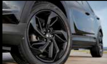
19인치 블랙 다이아몬드 커팅 휠