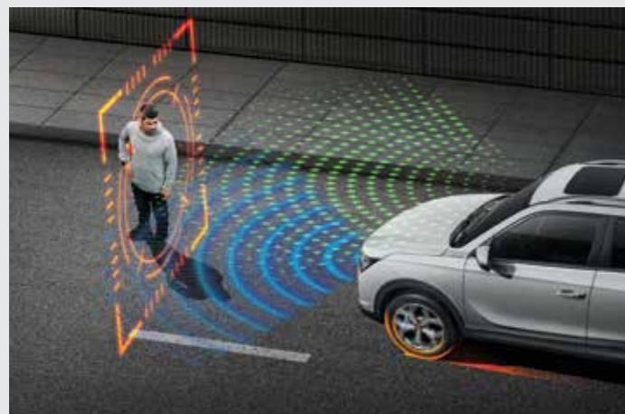
긴급 제동 보조 AEB (Autonomous Emergency Braking) 주행 중 전방충돌이 예상될 경우 자동으로 제동 브레이크를 작동시켜 사고를 미연에 방지해줍니다.