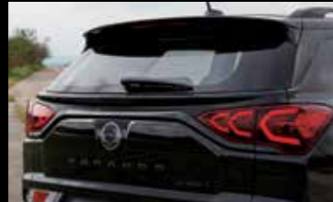
블랙 테일게이트 엠티라인