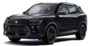
스페이스 블랙 LCK