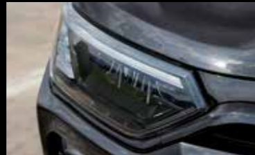
헤드램프 블랙 몰딩