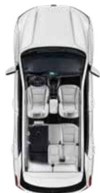
2열 40% 폴딩