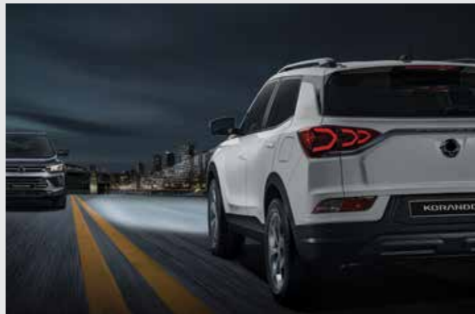
스마트 하이빔 SHB (Smart High Beam) 앞 차량의 리어컴비 램프 및 맞은편 차량의 헤드램프, 주변 밝기 상태를 감지하여 상향 또는 하향등으로 자동 전환되는 기능입니다.