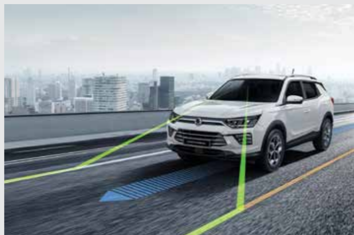
중앙 차선 유지 보조 CLKA (Centering Lane Keeping Assist) 주행 시 스스로 스티어링 휠(EPS)을 작동하고 차선을 중앙으로 유지하여 주행할 수 있게 하는 시스템입니다.