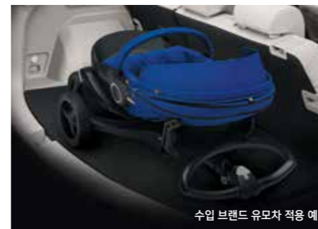
2단 매직 러기지 보드 장착 시