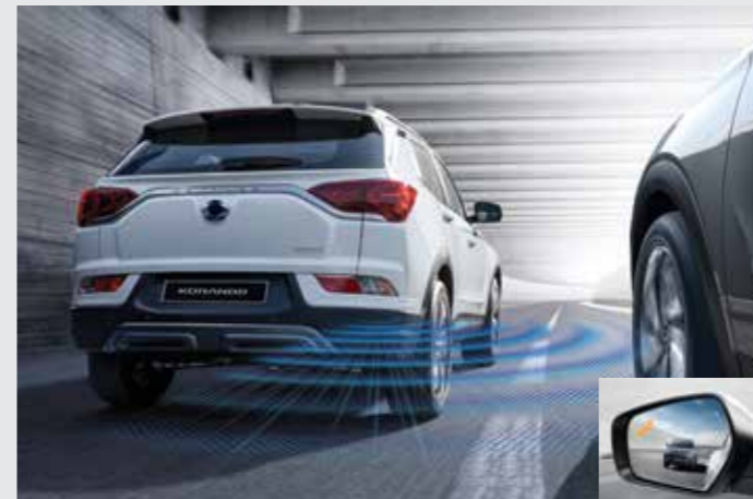
후측방 경고 BSW (Blind Spot-Detection Warning) 후방 사각지대에 근접되어 있는 차량을 감지하여 아웃사이드미러의 경고등이 점등합니다.