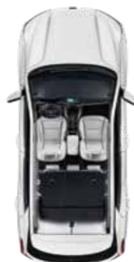
2열 100% 폴딩