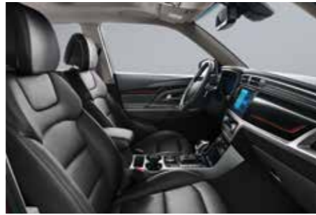
차콜 블랙 인테리어(그레이 헤드라이닝)