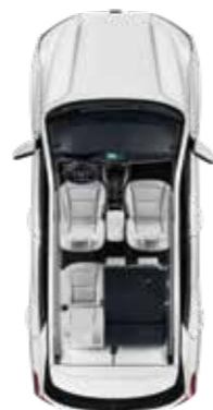
2열 60% 폴딩