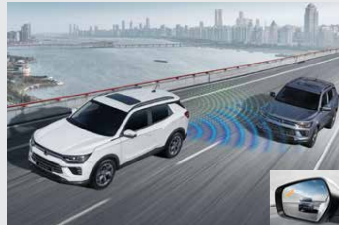
차선 변경 경고 LCW (Lane Change-Collision Warning) 차량 후측방에서 빠른 속도로 접근하는 70m 이내 차량을 감지하여 아웃사이드미러의 경고등을 점멸시키고, 경고음을 울립니다.