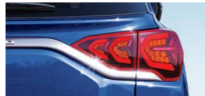
LED 리어 콤비램프(LED 제동등, LED 미등)