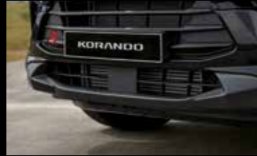
블랙 인테이크 홀 그릴