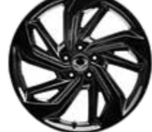
19인치 블랙 다이아몬드 컷팅 휠 (타이어 : 235/50R19)