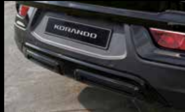
블랙 리어 스키드 플레이트