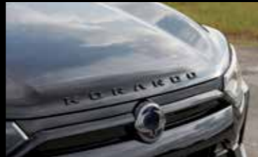
블랙 KORANDO 레터링(전면/후면)