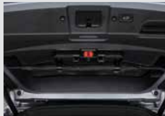
멀티 우산꽃이(우산꽃이 + 비상등 + 테일게이트 스텝램프) 150,000원