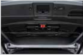
멀티 우산꽂이(우산꽂이 + 비상등 + 테일게이트 스팟램프) 150,000원