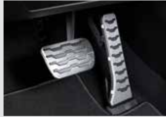
스포츠 페달 40,000원