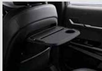
시트백 테이블 300,000원