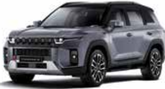
아이언 메탈 2DE