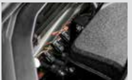
LPG 인젝터 엔진 인젝터에 LPG를 분사하는 장치