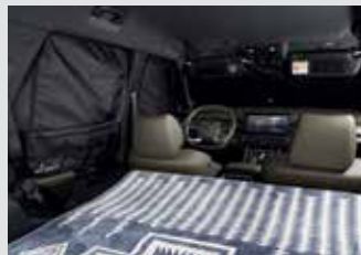
멀티 커튼 100,000원