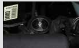
전자식 기화기 액체형태의 LPG가스를 기체상태로 변환하는 전자식 장치