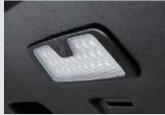
테일게이트 LED 램프 120,000원