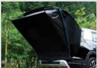
차박용 텐트 380,000원