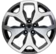
18인치 다이아몬드 컷팅 휠