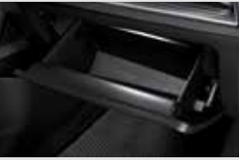
1열 풋램프 & LED 글로브 박스 램프 50,000원