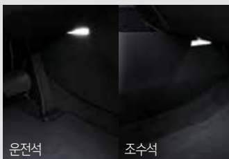
운전석 조수석 1열 풋램프 & LED 글로브 박스 램프 50,000원