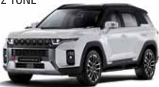
그랜드 화이트 2WA