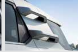
루프 클라이밍 핸들(원톤/투톤) 300,000원