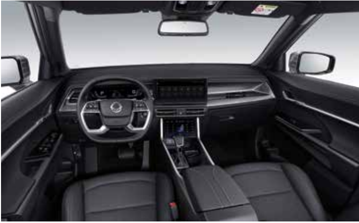
블랙 인테리어 (블랙 헤드라이닝)