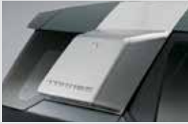
사이드 스토리지 박스(원톤/투톤) 300,000원