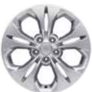
17인치 알로이 휠