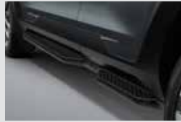
사이드 스탭(좌/우) 450,000원