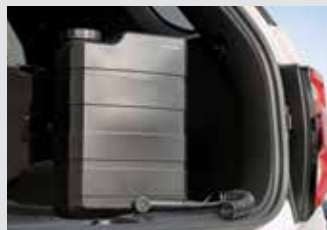
리어 패키지 (아웃도어 워터탱크 / 후대용 멀티 에어 컴프레서) 280,000원