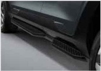
사이드 스텝(좌/우) 450,000원