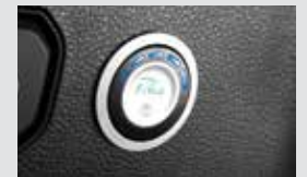
LPG 스위치 LPG 충전량 표시 및 LPG와 가솔린 전환