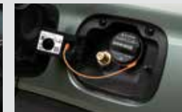
LPG 주입구 가솔린과 LPG 연료를 구분할 수 있도록 주유구를 이원화