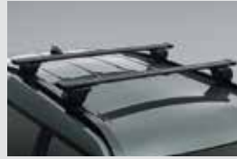
루프 플랫폼 캐리어 800,000원