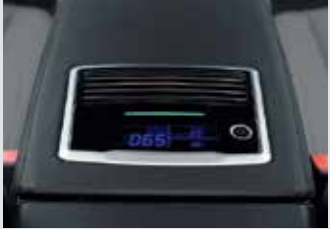
빌트인 공기청정기 400,000원