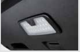
테일게이트 LED 램프 120,000원