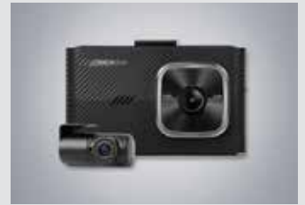
아이나비 블랙박스(16GB) 220,000원