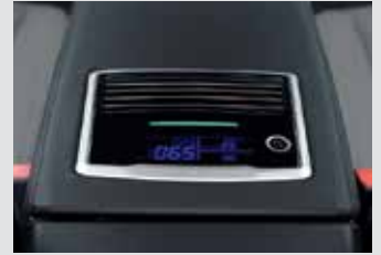
빌트인 공기청정기 400,000원