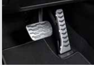
스포츠 페달 40,000원