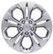
17인치 알로이 휠