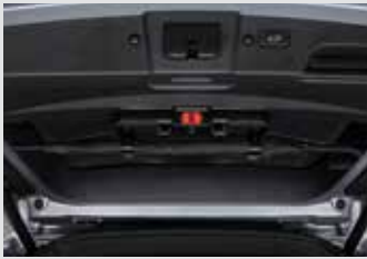
멀티 우산꽃이(우산꽃이 + 비상등 + 테일게이트 스팟램프) 150,000원