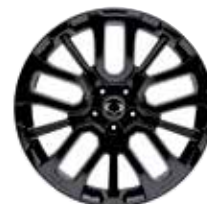
20인치 블랙 다이아몬드 커팅 휠