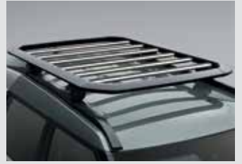
루프 플랫폼 캐리어 800,000원