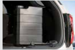
레저 패키지 (아웃도어 워터탱크/휴대용 멀티 에어 콤프레서) 280,000원