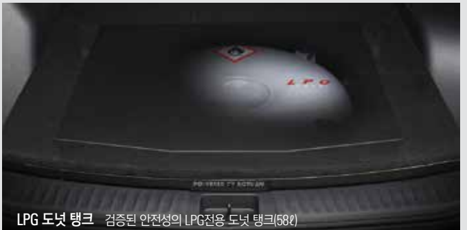
LPG 도넛 탱크 검증된 안전성의 LPG전용 도넛 탱크(58ℓ)