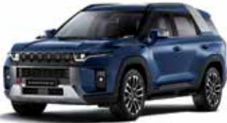
맨디 블루 BAS