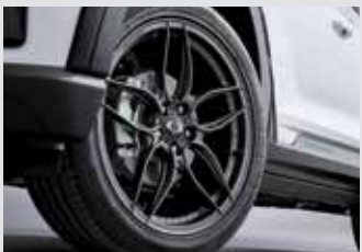
20인치 단조휠 2,980,000원