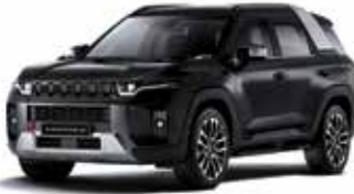
스페이스 블랙 LAK