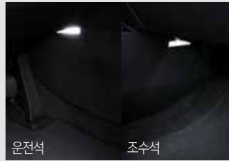
1열 풋램프 & LED 글로브 박스 램프 50,000원