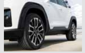
휠 아치 & 도어 가니쉬 600,000원