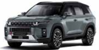
포레스트 그린 2GO

* 투톤 : 루프 / 스포일러 / C필러 : 블랙 컬러(LAE) * 투톤 선택 시 세이프티 선루프 선택 불가 * 본 가격표에 수록된 제품의 색상은 인쇄된 것이므로 실제 색상과 다소 차이가 있을 수 있습니다.