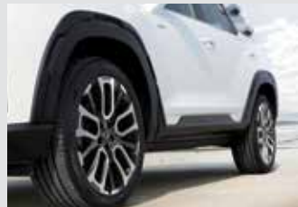
휠 아치 & 도어 가니쉬 600,000원