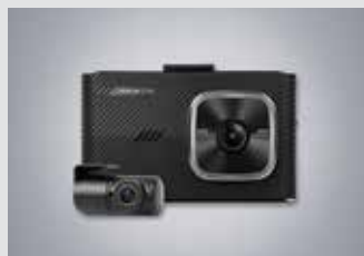
아이나비 블랙박스(16GB) 220,000원