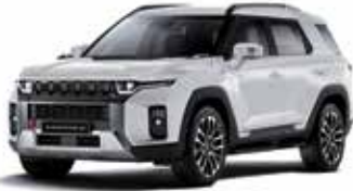
그랜드 화이트 WAA