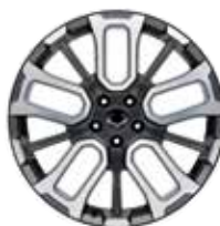
20인치 다이아몬드 커팅 휠