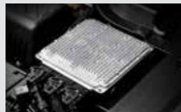
LPG ECU LPG전용 ECU로서 가솔린 ECU와 협업하여 2개 연료를 최적화