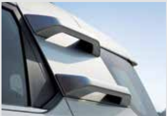
루프 클라이밍 핸들(원톤/투톤) 300,000원