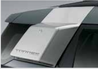
사이드 스토리지 박스(블랙 기본/실버 옵션) 300,000원