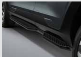
사이드 스텝(좌/우) 450,000원