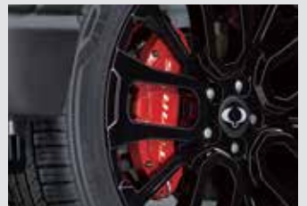
레드 알루미늄 캐리어 커버 300,000원