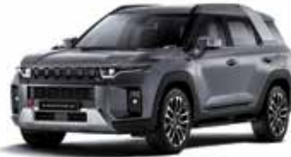
플래티넘 그레이 ADA