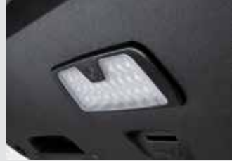
테일게이트 LED 램프 120,000원