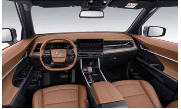
브라운 인테리어 (블랙 헤드라이닝)