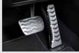
스포츠 페달 40,000원