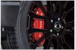
레드 알루미늄 캘리퍼 커버 300,000원