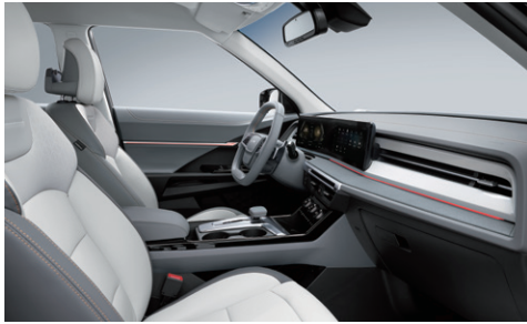
그레이 투톤 인테리어 (헤드라이닝 : 그레이)