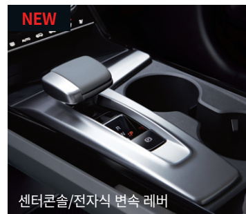
NEW 센터콘솔/전자식 변속 레버