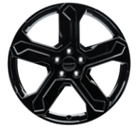
20인치 블랙 다이아몬드 커팅 휠