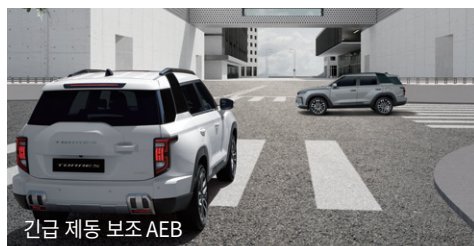
긴급 제동 보조 AEB