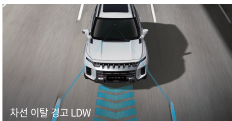
차선 이탈 경고 LDW