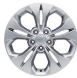
17인치 알로이 휠