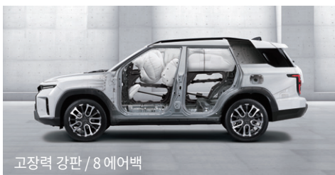
고장력 강판 / 8에어백

도로의 제한 속도를 인식하여 차량 속도가 제한 속도를 넘지 않도록 경고하고 보조하는 기능입니다.