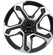
20인치 다이아몬드 커팅 휠