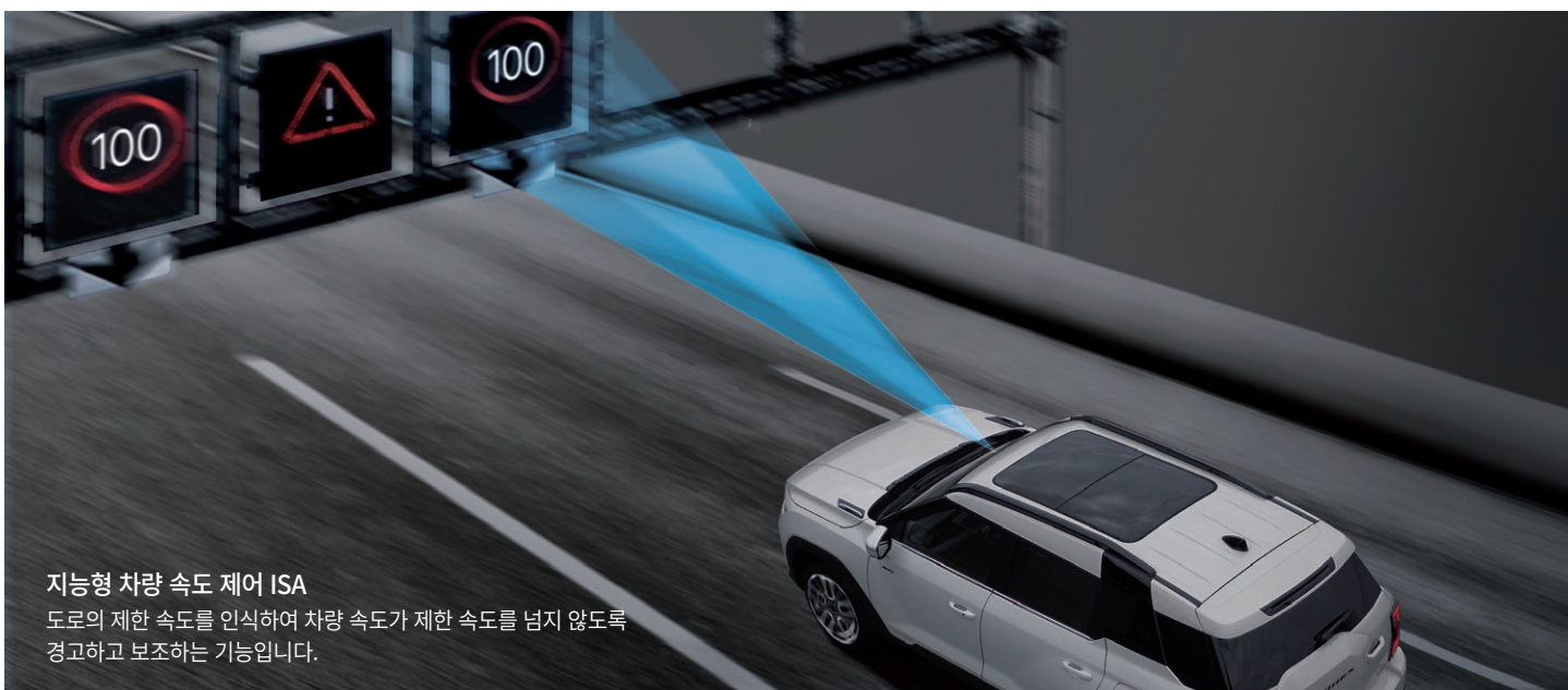
지능형 차량 속도 제어 ISA

도로의 제한 속도를 인식하여 차량 속도가 제한 속도를 넘지 않도록 경고하고 보조하는 기능입니다.