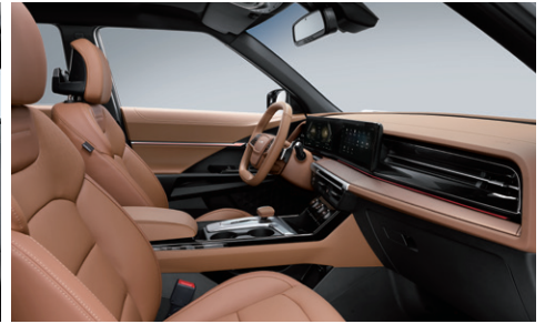
브라운 인테리어 (헤드라이닝 : 블랙)