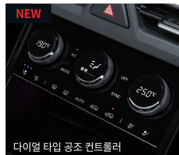
NEW 다이얼 타입 공조 컨트롤러