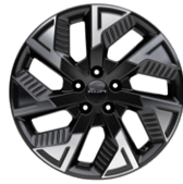
18인치 다이아몬드 커팅 휠