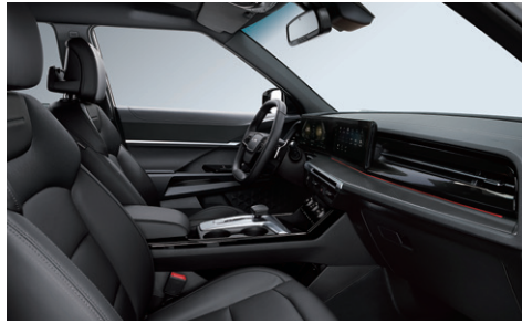
블랙 인테리어 (헤드라이닝 : 블랙)