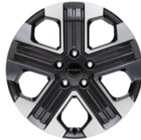
20인치 다이아몬드 커팅 휠