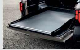
슬라이딩베드 스탠다드 1,000,000원 롱 1,100,000원