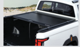
슬라이딩커버 스탠다드 1,300,000원 롱 1,400,000원