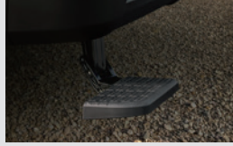
리어 스텝 350,000원