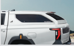
하드탑 스탠다드 2,100,000원 롱 2,350,000원