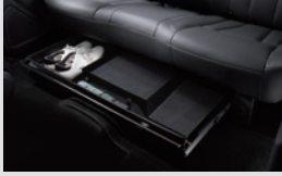
2열 언더트레이 220,000원