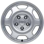
17인치 알로이 휠