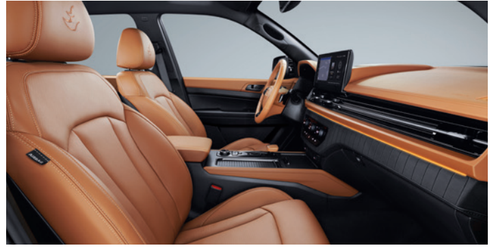
브라운 인테리어(헤드라이닝 : 블랙)