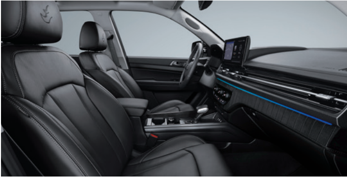
블랙 인테리어(헤드라이닝 : 그레이)