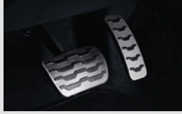
스포츠 페달 60,000원