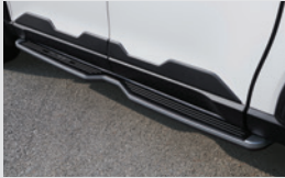
고정식 사이드 스텝 450,000원