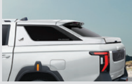
쿠페탑 스탠다드 2,350,000원 롱 2,550,000원