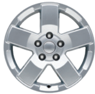
18인치 알로이 휠