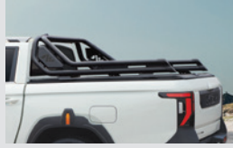
롤바 스탠다드 750,000원 롱 850,000원

* 상기 품목은 취급 설명서 내 커스터마이징 품목 보증서에 따라 보증 적용됩니다.