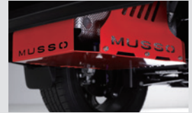
요소수 커버 200,000원