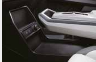
플로팅 타입 센터 콘솔