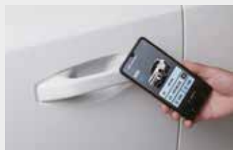
디지털키 (NFC 카드 타입)