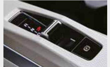
토크스위치 타입 전자식 변속시스템