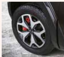
255/55R18 All Terrain 타이어