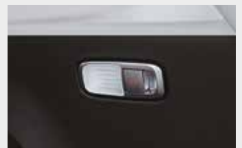
테일게이트 실내 문열림 버튼