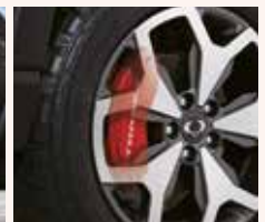
레드 알루미늄 캘리퍼 커버