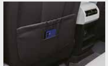
시트백 포켓 (스마트폰 포켓)