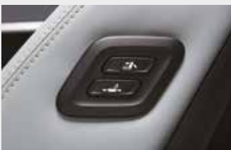
동승석 워크인 디바이스