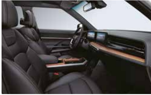
블랙 인테리어 (헤드라이닝 : 블랙)