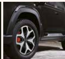
휠아치 & 도어 가니쉬