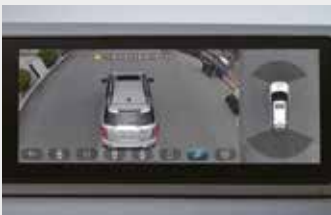
3D 어라운드 뷰 모니터링 시스템