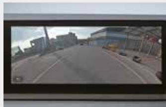
드라이빙 리어 뷰 / 클리어 사이트 그라운드 뷰