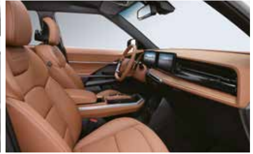
브라운 인테리어 (헤드라이닝 : 블랙)