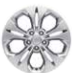
17인치 알로이 휠 (타이어 : 225/60R17)