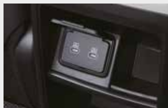
USB C타입 단자(1열/2열)