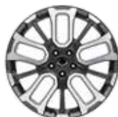
20인치 다이아몬드 컷팅 휠 (타이어 : 245/45R20) * 더 뉴 토레스 밴에는 미적용