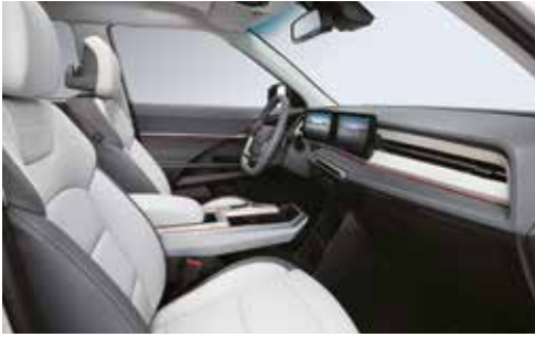
그레이 투톤 인테리어 (헤드라이닝 : 그레이)