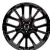
20인치 블랙 다이아몬드 컷팅 휠 (타이어 : 245/45R20) * 더 뉴 토레스 블랙 에디션에만 적용