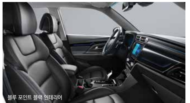
블루 포인트 블랙 인테리어